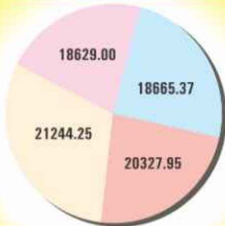
Advances (₹ in Lacs)