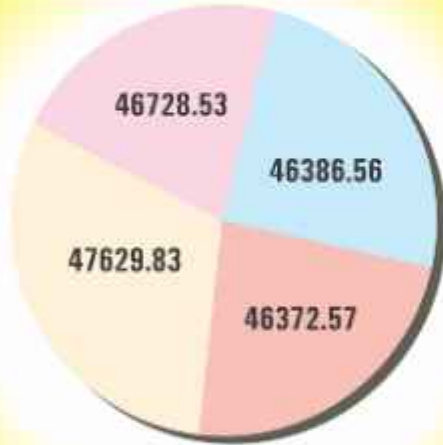
Deposits (₹ in Lacs)