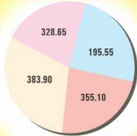
Profit (₹ in Lacs)