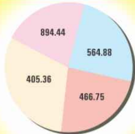
GROSS N. P. A. (₹ in Lacs)